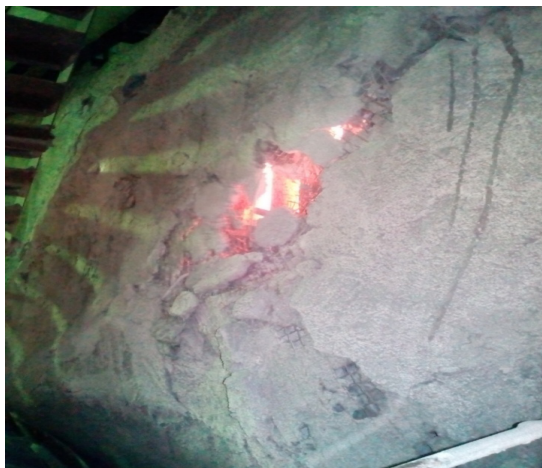
Рисунок 1 – Разрушение обмуровки котельного агрегата

При этом, согласно [4] котел немедленно останавливается и отключается: при взрыве в топке, взрыве или загорании горючих отложений в газоходах и золоулавливающей установке, разогреве докрасна несущих балок каркаса или колонн котла, при обвале обмуровки, а также других повреждениях, угрожающих персоналу или оборудованию. Таким образом, ресурс работы обмуровки является важным показателем при работе котельного агрегата, причём для ряда оборудования он является определяющим фактором при их работе.