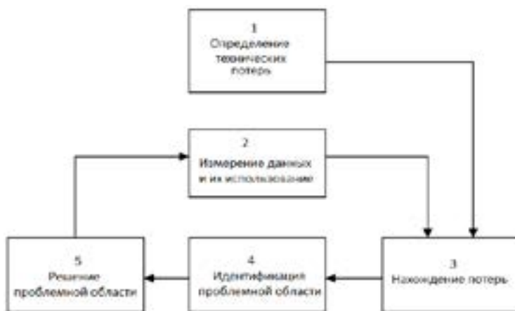
Рисунок 1 – Функциональная схема модели

Модель, которая будет использоваться для разработки стратегии минимизации потерь электроэнергии в распределительной сети, состоит из пяти этапов, представленных на рисунке 1.